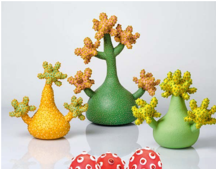
← Bloom , 2025, porcelaine, teinture colorée et glaçure, H. entre 27,5 et 44,5 cm